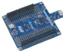
소켓 부착 X-Mini (인강 실습교재용)