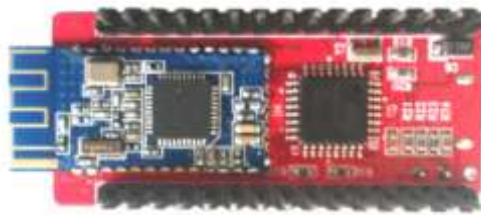
(뒷면 : HM-10 BLE 버전 블루투스 내장, 추후 출시 예정)