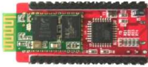
(뒷면 : HC-05 블루투스 내장)