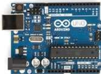
Arduino UNO R3